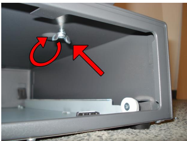
5. Přišroubujte pokladnu k zásuvce