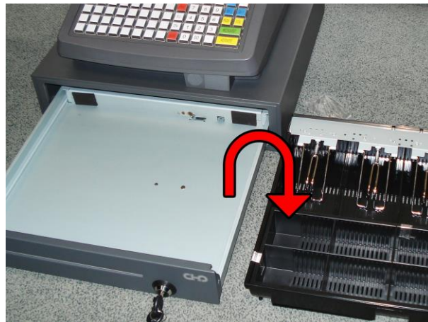
2. Vyjměte mincovník