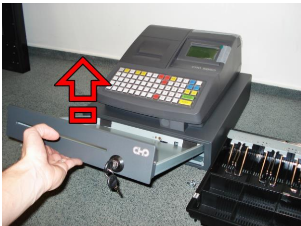
3. Nadzdvihněte posuvnou část zásuvky a vyjměte ji