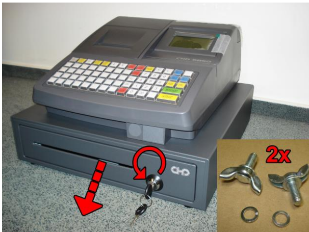
1. Otočte klíčkem vlevo, zásuvka se vysune